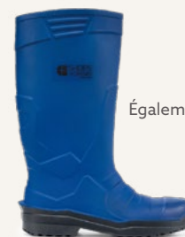
Sentinel Bleu : 2012