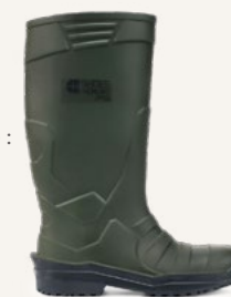
Sentinel Vert : 2011