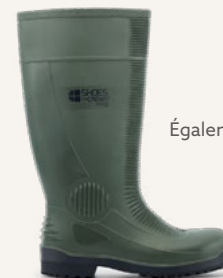
Guardian Vert : 2018

Test EN ISO 20344:2021 effectué pour déterminer la résistance au glissement par Intertek Testing Services Shenzhen Ltd, en août 2022. Sur une échelle où 0 correspond à l'absence de friction et 1 à une très forte friction (par exemple, sur un tapis sec). Toutes les chaussures SFC sont équipées de la semelle extérieure antidérapante brevetée Shoes For Crews. Produit testé : Carrig Low 62201.