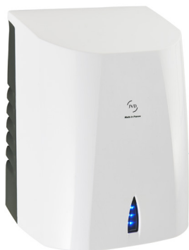
REF 8 11 1056 Sup'air automatique blanc

Sèche-mains automatique à air pulsé à faible consommation d'énergie (500 W). Garantie 3 ans pièces et main d'oeuvre.