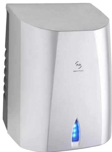
REF 8 11 1057 Sup'air automatique Gris métal